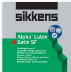
Alpha Latex Satin SF die preiswerte Objektlatexqualität