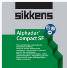
Alphadur Compact SF der „Einmaldecker“ bei Renovierungen und Neuanstrichen Deckkraft Kl. 1

Wie Sie wissen, setzt Sikkens Maßstäbe bei Lacken und Lasuren. Mit dem optimierten Innenwandsortiment wollen wir Ihnen auch bei Wandfarben die gewohnten Standards bieten und in diesem Bereich hinsichtlich Wirtschaftlichkeit aufholen. Das neue Sortiment gibt es ab sofort bei Ihrem Sikkens Großhändler. Das neue Sortiment erfüllt alle Anforderungen in puncto Wirtschaftlichkeit, Beständigkeit und Farbtonvielfalt. Darüber hinaus tragen wir der gesteigerten Nachfrage nach umweltfreundlichen Produkten mit unserer Lösemittel(SF)- und Emissionsfreiheit Rechnung. Wir möchten Ihnen kurz die Besonderheiten daraus präsentieren.