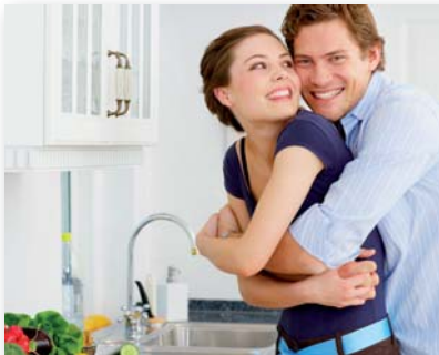
Das eigene Zuhause wird zum Lebensmittelpunkt

Wie alle Produktsysteme von Sikkens sind auch die Alpha Farben über das Mix2Win-System tönbar. In bester Qualität und allen angesagten Trendfarbtönen. Die Farbtöne zeichnen sich durch eine hohe Sättigung aus, sogar bei schwierigen Tönen wie Gelb, Orange und Rot ist das Ergebnis dank der guten Deckkraft perfekt.