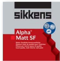
Alpha Matt SF der neue Standard für wirtschaftliche Objektrenovierungen