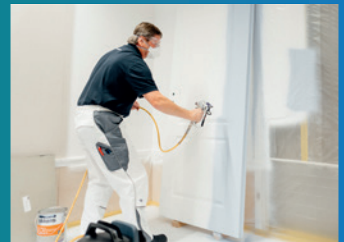
Ein AkzoNobel Anwendungstechniker zeigte die einfache Handhabung der Airless-Produkte von Sikkens und Herbol.