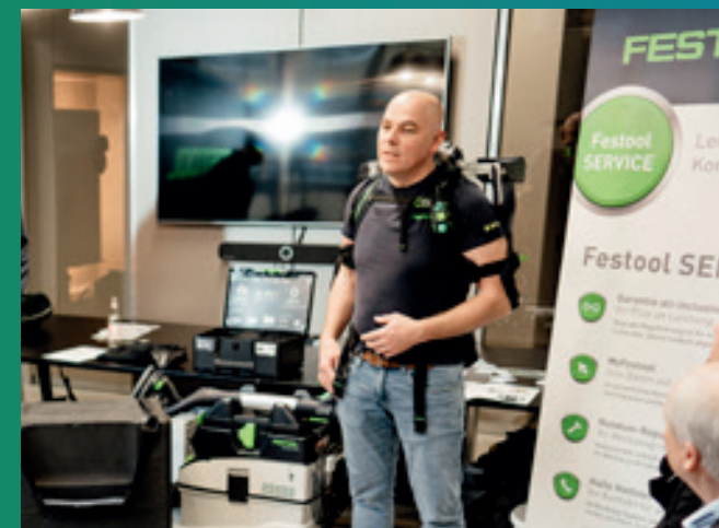
Das akkubetriebene Exoskelett ExoActive von Festool erleichtert das anstrengende Über-Kopf-Arbeiten und entlastet Nacken sowie Arme.