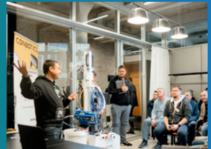
ConBotics ist der leichteste Malerroboter der Welt.