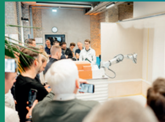
Der Malerroboter PACO beschichtet autonom Flächen bis 3,5 m Höhe.